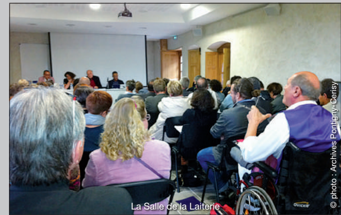
La Salle de la Laiterie

- Offrir , outre l'intérêt du thème choisi, une grande qualité de l'accueil et une heureuse convivialité des rencontres.