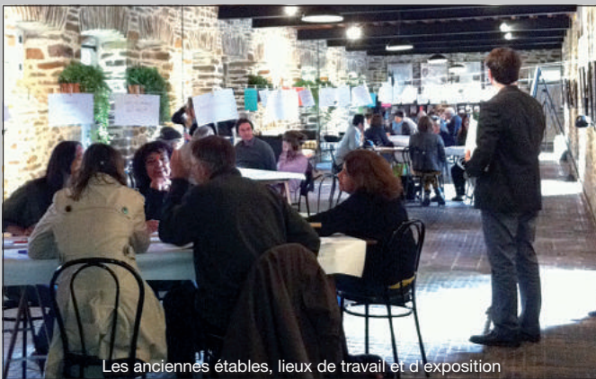
Les anciennés étables, lieux de travail et d'exposition