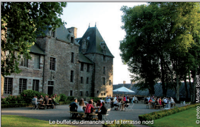
Le buffet du dimanche sur la terrasse nord