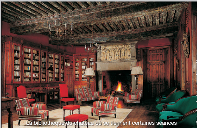
La bibliothèque du château où se tiennent certaines séances

Le site est classé Monument Historique "en raison de la qualité architecturale et de la grande cohérence de l'ensemble, en tant que haut lieu de la culture et de l'histoire, y compris celle de la pensée moderne".